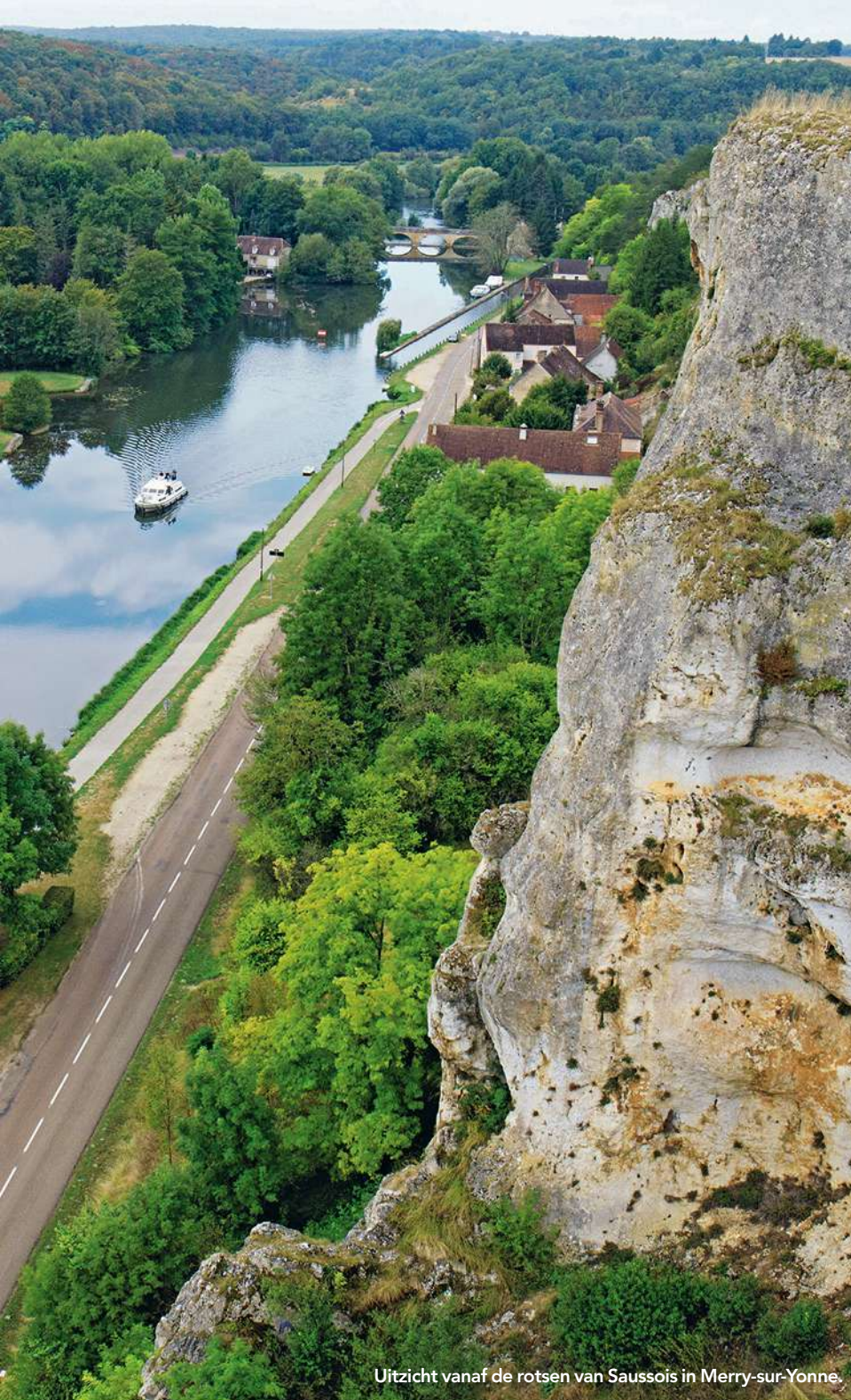
Uitzicht vanaf de rotsen van Saussois in Merry-sur-Yonne.