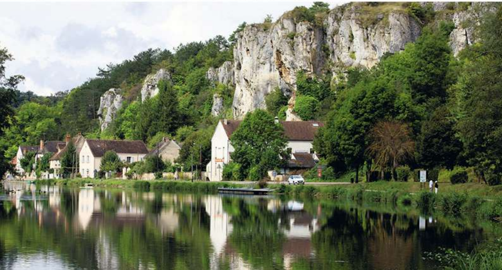
Op veel plekken langs de vaarroute kun je wijn proeven. Onder: de rotsen van Saussois.

bewonderen. Het is een prachtig schouwspel, temeer omdat er nauwelijks lichtvervuiling is. De stilte van de nacht is bedwelmend, en zacht wiegend op de stroming denk ik aan alle leuke dingen die ons de komende dagen te wachten staan. We gaan overal aanleggen om wijn te proeven. Er zijn fietsen aan boord om de omgeving te verkennen. En over een paar dagen liggen we met