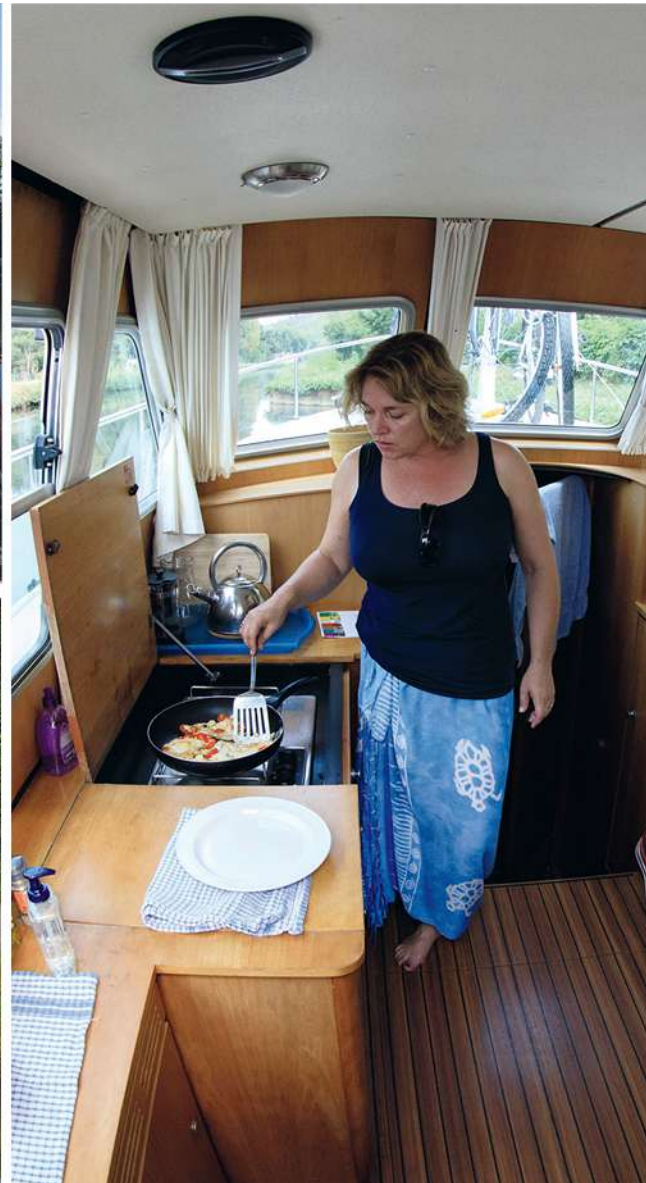
Boven: net buiten de haven van Vermenton, op weg naar Auxerre.